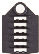
TS6 svetshylshållare 6-pos