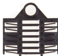
TS12 svetshylshållare 12-pos