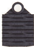
TS8 svetshylshållare 8-pos