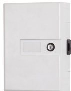
SOP24 skarv-/ droppbox IP30