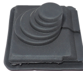
Genomföring 40x40mm till SOP24