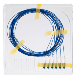
Pigtail SM LC/UPC 1.5m 6-Pack